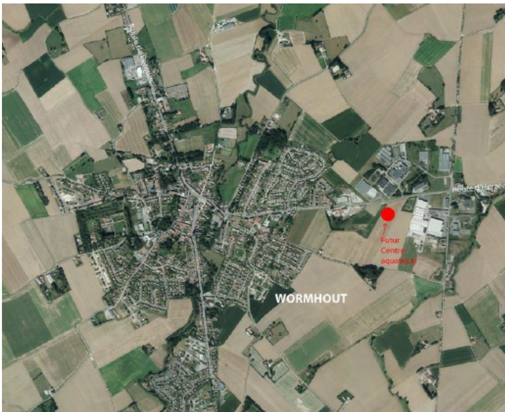
Localisation de la zone modifiée : point rouge

La modification du plan local d'urbanisme vise la réalisation d'un projet de centre aquatique. Elle consiste à classer en zone urbaine destinée à accueillir des équipements collectifs (zone UP) environ 5 hectares de foncier agricole, actuellement classés en zone d'urbanisation future destinée à accueillir des activités économiques (zone 1AUe1), afin de permettre la réalisation d'un centre aquatique et de constituer une réserve foncière. L'orientation d'aménagement et de programmation du secteur de développement économique de la Kruystraëte est modifiée en conséquence.